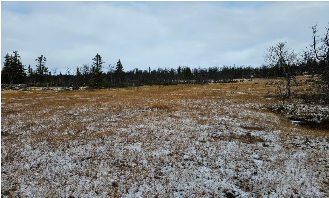
Figur 1: Slåttemyr i god tilstand ved Javnlie i Øystre Slidre kommune.

De mest iøynefallende naturverdiene i de undersøkte områdene er forekomstene av slåttemyr. Mange av slåttemyrene er fortsatt i sjeldent god tilstand siden gjengroingen ikke har kommet ordentlig i gang (figur 1).